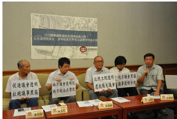
2016年7月27日「2016議會議事透明度調查結果公開」記者會現場

全督盟呼籲全台灣縣市議會應努力提升議事透明程度，以回應人民對民意代表的期待，而縣市議會議事人員應秉持自身專業，將相關紀錄公開，以逐步提升議事品質，向議事透明的議會看齊，未來，全督盟將持續監督各地議會，為社會大眾把關！！