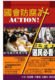
《國會防腐計 ACTION!》 讓台灣國會脫線、醜態、惡行和亂象，不再重蹈覆轍，義賣價300元