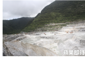
【蘋果日報】 亞泥礦場案協商 原轉會：三方達初步共識 ( 詳見全文 )