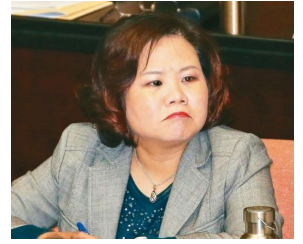
【聯合新聞網】 赴立法院報告 許銘春：推最低工資及職災保險立法 ( 詳見全文 )