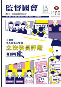
《監督國會》季刊第156期 全國唯一國會監督專刊 來電免費索取 02-2367-1571