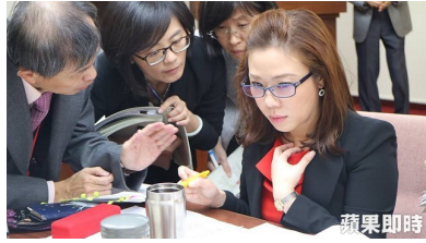
【蘋果日報】 提《空污法》黨版 藍：反對政院霸王條款 ( 詳見全文 )