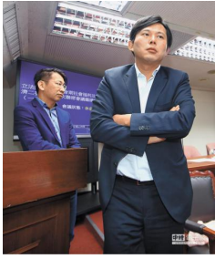
【中時電子報】 深澳電廠威脅健康 地方議員群起質疑！黃國昌放水 大汐止居民遭殃 ( 詳見全文 )